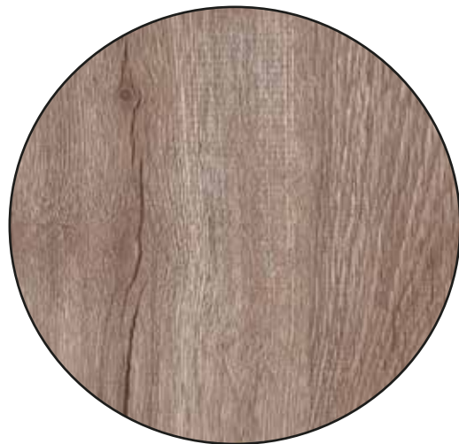
ARABIC RUSTIC OAK 2201