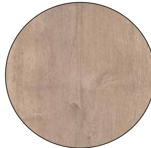
MEDITERRANIAN OAK 2218