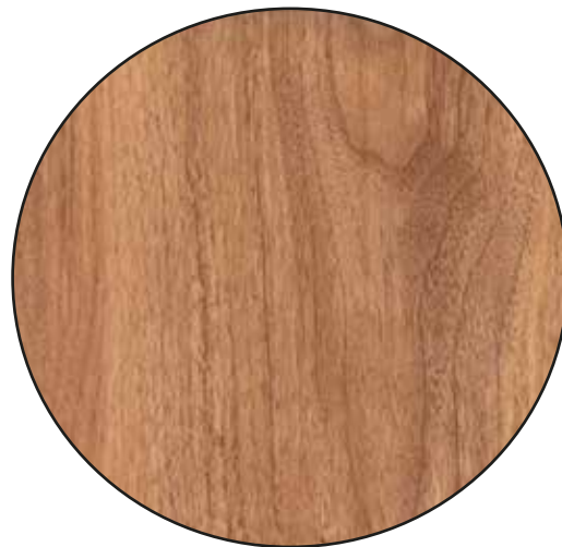
PERSIAN OAK 2279